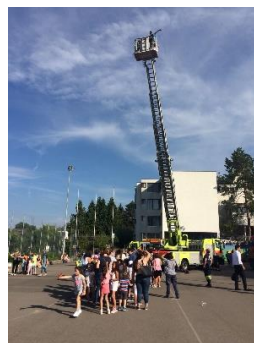
Hoch hinaus ging es am Berglifest 2018

Euer Elternrat Bergli mit Pius Steffen (Info & Kolumnen)